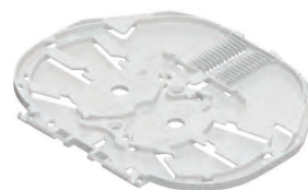
▲ SC- & SE-Kassetten