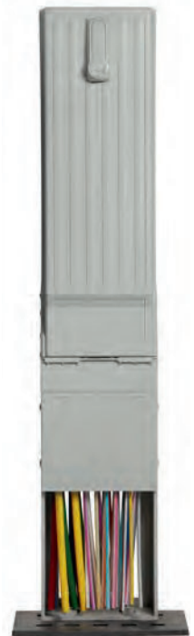
▲ G f-NVt Small geschlossen