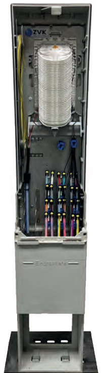
▲ Gf-NVt Small ohne Haube mit geöffneter Gehäuseklappe