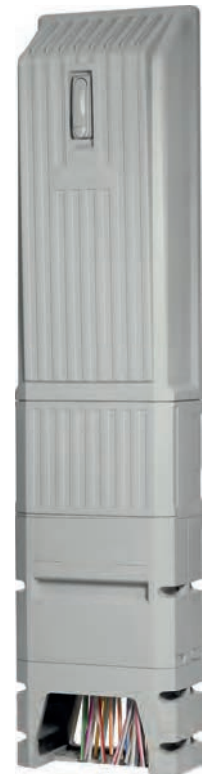
▲ Gf-NVt Medium geschlossen