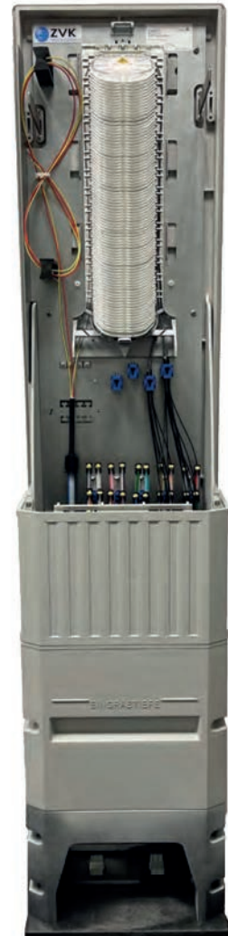
▲ Gf-NVt Medium geöffnet