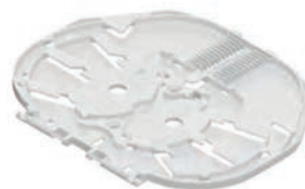
▲ SC- & SE-Kassetten